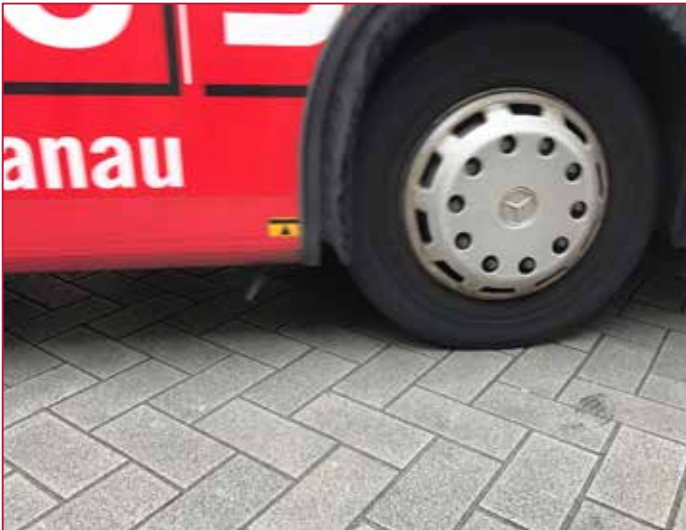
Befahrene Nebenstraßen | Trafficked side roads