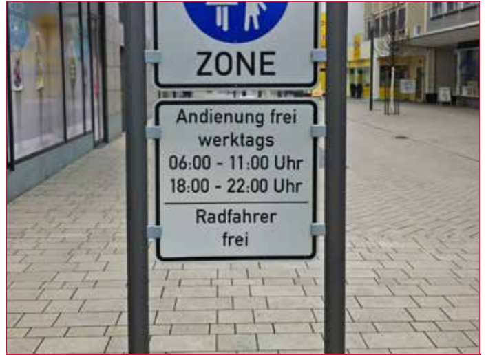
Belastungen müssen in der Planung berücksichtigt werden Loads have to be considered during planning