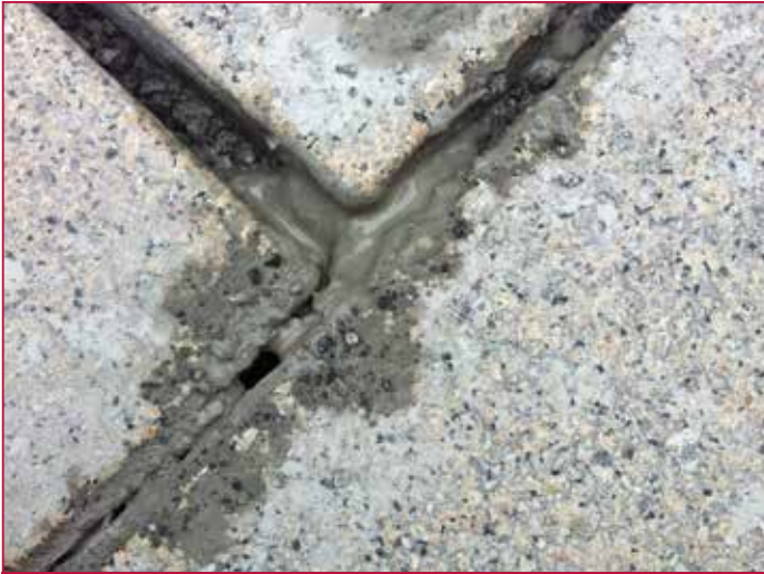
Zermahlene Bettung als Folge fehlenden Fugenmaterials Crumbled Bedding as a result of missing joint material