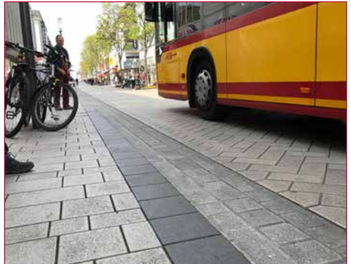
Fußgängerzone mit Bus- und Lkw-Verkehr | Pedestrian zone with bus and truck traffic